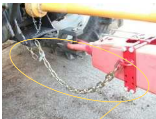
チェーン等の丈夫な装置でつなぐ

なお、けん引車は農耕トラクタに限られ、けん引式農作業機に積載可能な物品は農耕作業に必要なものに限られていますので、コンパイントレーラ等の汎用性が高いものは注意が必要です。