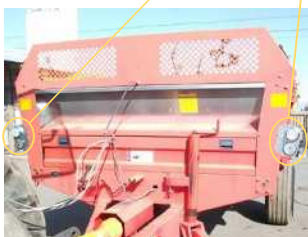
前部反射器及び車幅灯の設置例