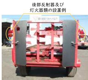
後部反射器及び灯火器類の設置例

※単体が長さ4.7m以下、幅1.7m以下、高さ2.0m以下、かつ、最高速度15km/h以下のいわゆる特定小型特殊自動車である農耕トラクタでけん引するけん引式作業機の場合、車幅灯、テールランプ、ブレーキランプ、バックランプについては取付義務がないので、これらを備える必要はありません（その場合でも、方向指示器、前部反射器、後部反射器は取付義務があります）。